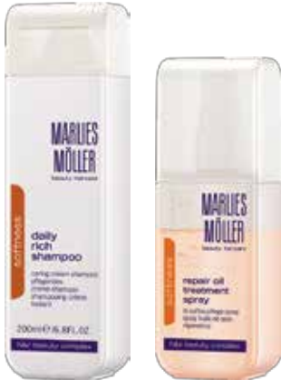
Daily Rich Shampoo

مخصوص بانوانی با موهای ضخیم و خشک که سخت کنترل میشوند و دوست دارند موهایشان نرمتر باشد. پس از به کار بردن مواد شیمیائی نیز مدل دادن به مو سخت‌تر از معمول است. در پاره‌ای از موارد حس می‌کنیم که فقط لازم است تا موهایمان کمی نرم‌تر و تغییر پذیرتر باشند.