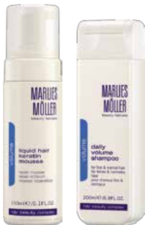
Liquid Hair Keratin Mousse

این محصولات مناسب موهای نازک، ضعیف و کم پشت است. محصولات حجم دهنده ما، تارهای مو را از هم دور میکنند و موها درست مثل دو قطب هم نام آهنربا یکدیگر را دفع می کنند. این مدل مو حجم زیادی دارد که مدت بیشتری دوام می آورد.