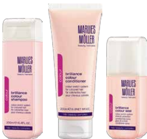
Brilliance Colour Shampoo

این محصول بطور خاص برای موهای رنگ شده تهیه شده و برای تغذیه عمیق مو مناسب است. علاوه بر اینکه ریشه مو را تقویت میکند، فرآیند از بین رفتن رنگ را به‌نگام شستن مو خنثی میکند و از رویش مجدد و سریع موهای خاکستری می‌کاهد.