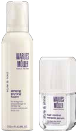
Strong Styling Foam Hair Control Miracle Serum

محصولات حالت دهنده برای هر نوع عملیات تکمیلی مو که مستلزم شکل دادن و نگه داشتن مو هستند، مناسب است. مدل‌های مختلف مو نیاز به پشتیبانی محصولات شکل دهنده و تثبیت کننده دارند. میزان ماندگاری مدل نه تنها به ویژگی‌های خود مو، که به حالت مد نظر نیز بستگی دارد. در حالی که برای پیرایش‌های پُر مانند یا حالت‌های کلاسیک، مثل موهای چتری میتوان محصولات حالت دهنده و تثبیت کننده سبک را به کار برد، برای آنکه موهای کوتاه مدرن یا موهای جمع شده بهترین حالت خود را نشان دهند باید از حالت دهنده هایی برای ثابت تر ماندن مو استفاده شود.