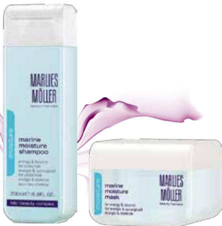
Marine Moisture Shampoo

رطوبت با ارزش اعماق اقیانوس، انرژی بیشتر و موج‌های درخشان را برای موهای شما به ارمغان می‌آورد. این محصولات به طرز شگفت‌انگیزی پرتراوت بوده و حاوی عصاره با ارزش جلبک، هیدروچیپتین، عصاره گرانقیمت مرارید هیدرولیزه یا پروویتامین B5 هستند که بلافاصله پس از استفاده به موهای شما پف و انرژی بیشتری می‌بخشند. استفاده از این محصولات، باعث تقویت و ایجاد رطوبتی سبک در مو می‌شود. به ویژه، مو و پوست سر نرمی خاصی پیدا خواهند کرد. مناسب تمام افرادی که دارای موهای نرمالی بوده و خواهان موهایی براق و طبیعی هستند.