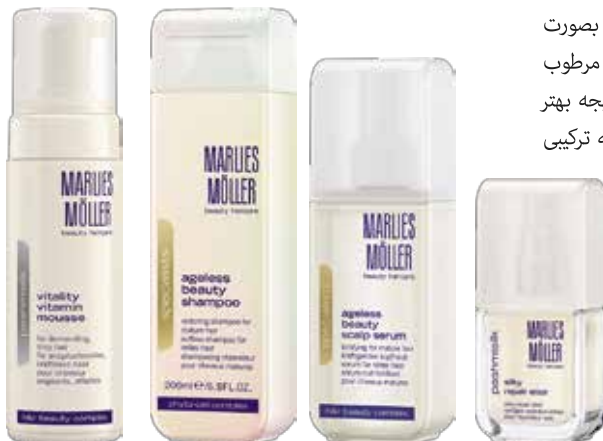
Vitality Vitamin Mousse

سرمی تقویت کننده ریشه مو با ترکیب فیتوسل است که سلول‌های بنیادی را که مسئول رشد مو هستند فعال میکند، فرآیند باز تولید ریشه مو را سرعت بخشیده و همچنین تک تک تارهای مو را تقویت میکند. این محصول باز تولید ریشه مو را افزایش می‌دهد، موهای در حال رشد را تقویت میکند، از پوست سر در برابر عوامل بیرونی منفی و اشعه‌های ماوراء بنفش محافظت میکند و رطوبت پوست سر را تامین میکند. پمپت را از سرم پر کنید و آن را بصورت یکنواخت روی تمام پوست سر در حالت خشک یا مرطوب بچکانید و به آرامی ماساژ دهید. سرم را برای دریافت نتیجه بهتر به همراه شامپوی جوان و زیباکننده مو استفاده نمایید که ترکیبی کامل در برابر نازک شدن و ریزش مو به شمار میرود.